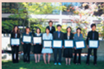
海外インターンシップを終えて After completion of international business internship