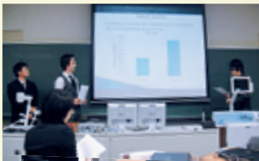
県内大学での留学生発表風景 Presentation of overseas students at an university in the prefecture

HUMAP (ヒューマップ:兵庫・アジア太平洋大学間交流ネットワーク)は、兵庫県内の大学とアジア・太平洋地域の大学との交流を盛んにし、地域の教育や研究の水準の向上を図るとともに、将来を担う人材を育成することを目的とする兵庫県独自の留学生・研究者支援プログラムです。